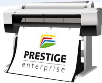
Large Format Printer